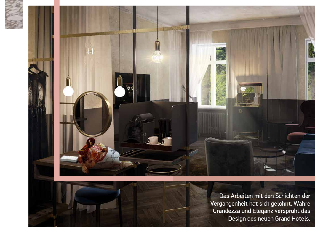
Das Arbeiten mit den Schichten der Vergangenheit hat sich gelohnt. Wahre Grandezza und Eleganz versprüht das Design des neuen Grand Hotels.

nem Zimmer oder direkt im „Schau-Fenster“ am Wanderweg – sowie Badeleitern und Badekappen als überraschende Designelemente.