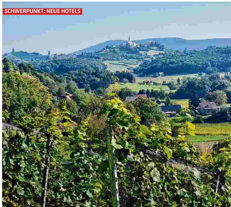
Für einen Ausblick auf Straden mit seinen drei Kirchtürmen und vier Kirchen muss man den Julianhof nicht verlassen.